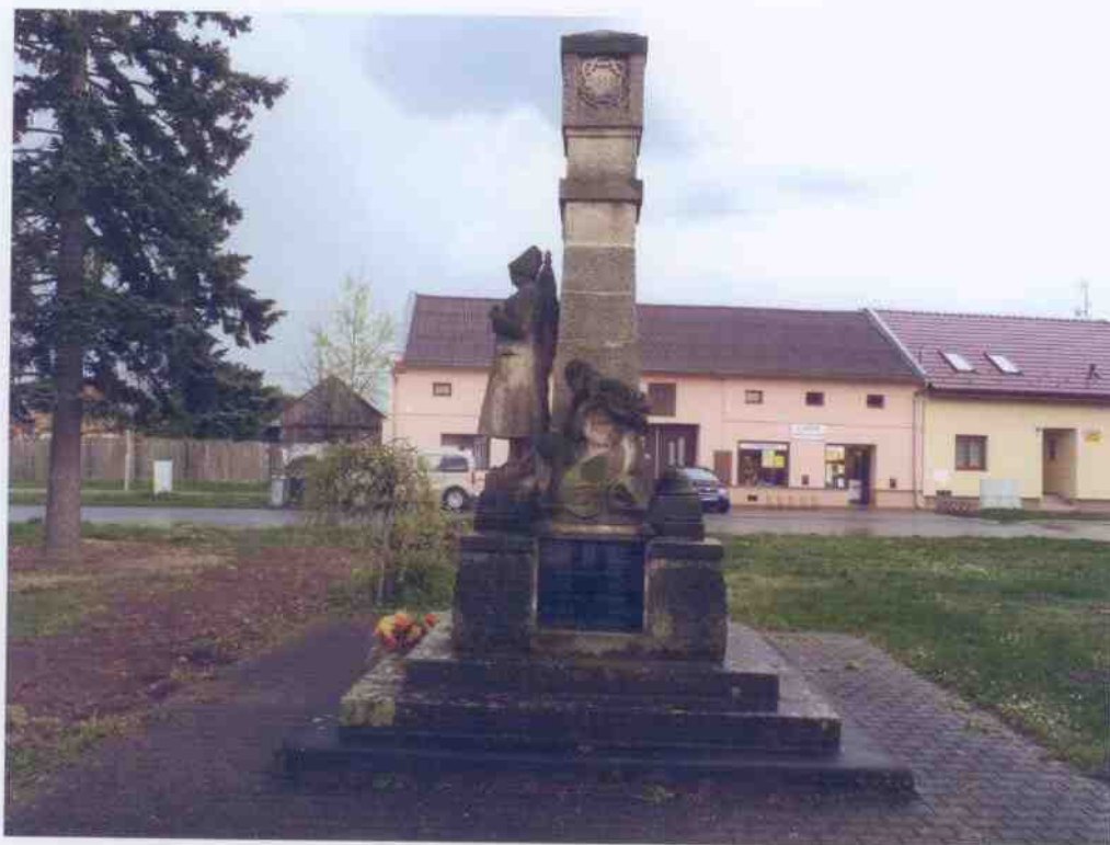
Celkový pohled na památku.