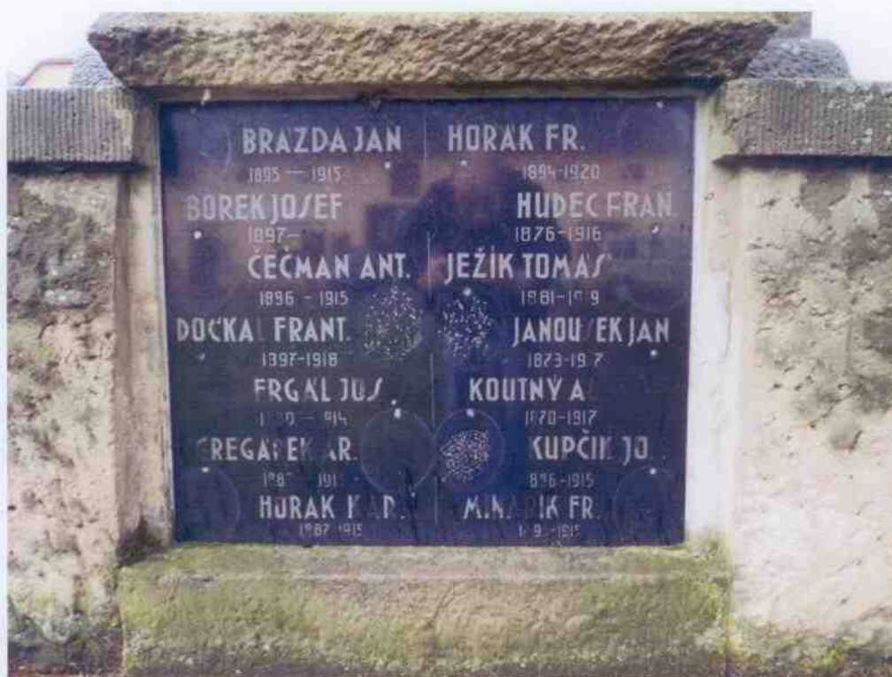
Nápisové desky se jmény padlých – barevnost písma není dochována, bude provedeno stříbření a přešetření desek.