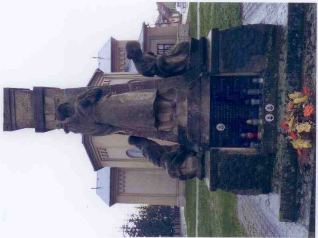
Čelní pohled na pomník se sochou vojína – povrch kamene je poškozen tmavými depozity, především v obličejové části vojína.