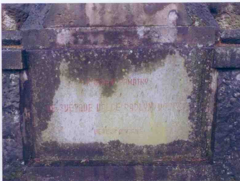
Detail poškození biologickým napadením.