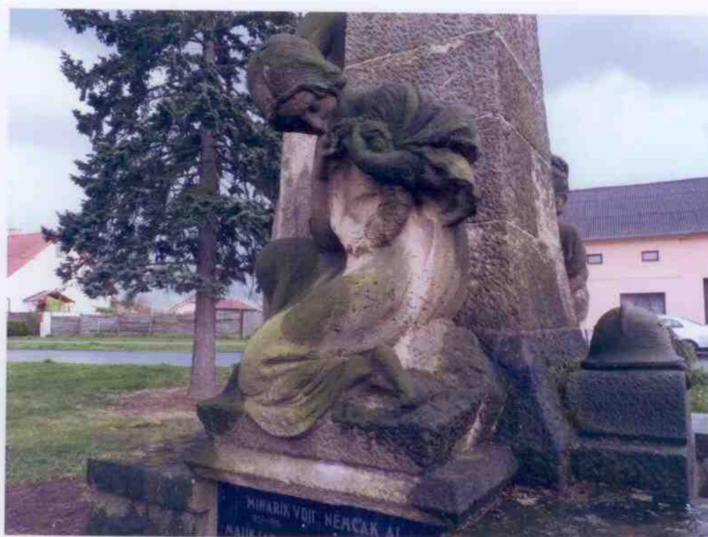
Figury po stranách pomníku – kámen je biologicky napaden, povrch je poškozený korozí kamene.