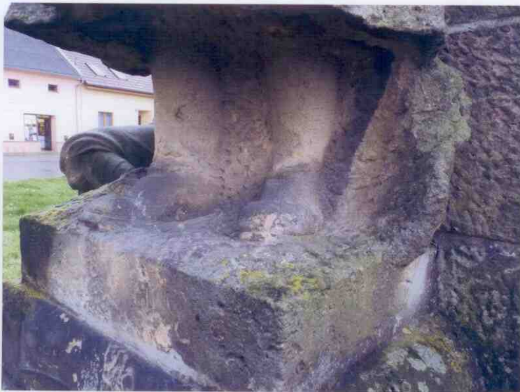
Detail poškození tmavými depozity a sádrovcovými krustami.