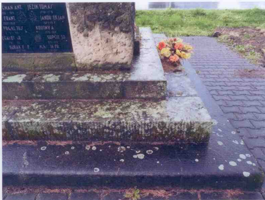
Detail poškození biologickým napadením.